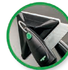
Druk de pad tegen het glas