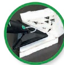
Bevestig een QuikPad