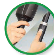
Druk de activatieknop in op de handunit of op de steel gedurende max. 1 seconde

Gebruik zo min mogelijk vloeistof tijdens het reinigingsproces. Als u de pad opnieuw wilt bevochtigen, houdt u de activeringsknop ongeveer een seconde ingedrukt. De pad hoeft alleen maar nat te zijn voor het beste reinigingsresultaat.