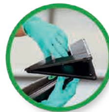
Monteer de adapterplaat