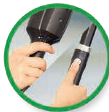
Druk de activatieknop in op de handunit of op de steel gedurende max. 5 seconden, bevochtig de pad met cirkelvormige bewegingen