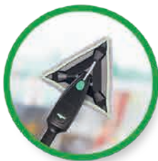
Druk de pad tegen het glas