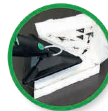
Appoggiare l'adattatore sul primo dei QuikPad della scatola per farlo aderire