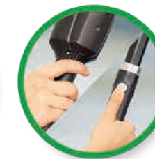
Premere il pulsante di erogazione sul corpo macchina o sull'asta max. 1 secondo

Utilizzare il minor quantitativo possibile di liquido durante il processo di pulizia. Se è necessario inumidire nuovamente il pad, tenere premuto il pulsante di attivazione per circa un secondo. Per ottenere i migliori risultati di pulizia è sufficiente che il pad sia bagnato.