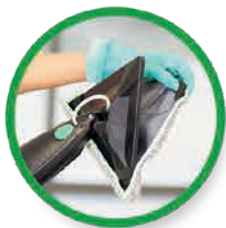
Inserire il TriPad in microfibra