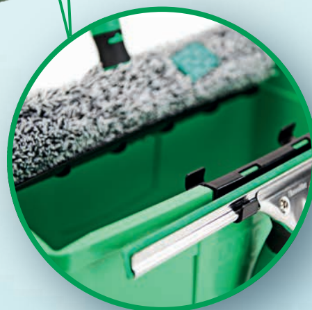
POSSIBILITÉS DE RANGEMENT FLEXIBLES POUR LES MOILLEURS ET LES RACLETTES JUSQU'À 35 CM