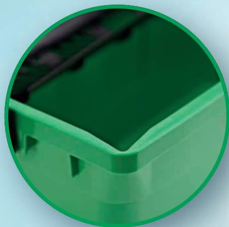
DEUX BECS VERSEURS