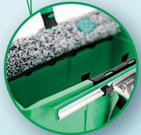
OPCIONES DE ALMACENAMIENTO FLEXIBLES PARA MOJADORES Y LIMPIACRISTALES DE HASTA 35 CM