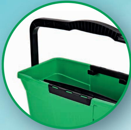
MANGO ROBUSTO ERGONÓMICO CON FIJACIÓN VERTICAL

Uno de los accesorios imprescindibles para el trabajo de limpiadores profesionales de cristales y ventanas es, sin duda, el cubo UNGER . La nueva edición de nuestro clásico cubo rectangular destaca por sus numerosos detalles prácticos, que facilitan en gran medida el trabajo diario. La capacidad del cubo es de 12 l y su forma estrecha y compacta ofrece espacio suficiente para utensilios importantes. Además, cuenta con dos bandejas para depositar con seguridad el mojadador y el limpiacristales. La característica más convincente, sin duda, es el nuevo mango ergonómico con fijación vertical . Es manejable y destaca sobre todo porque se puede fijar de forma inteligente y no se pliega involuntariamente.